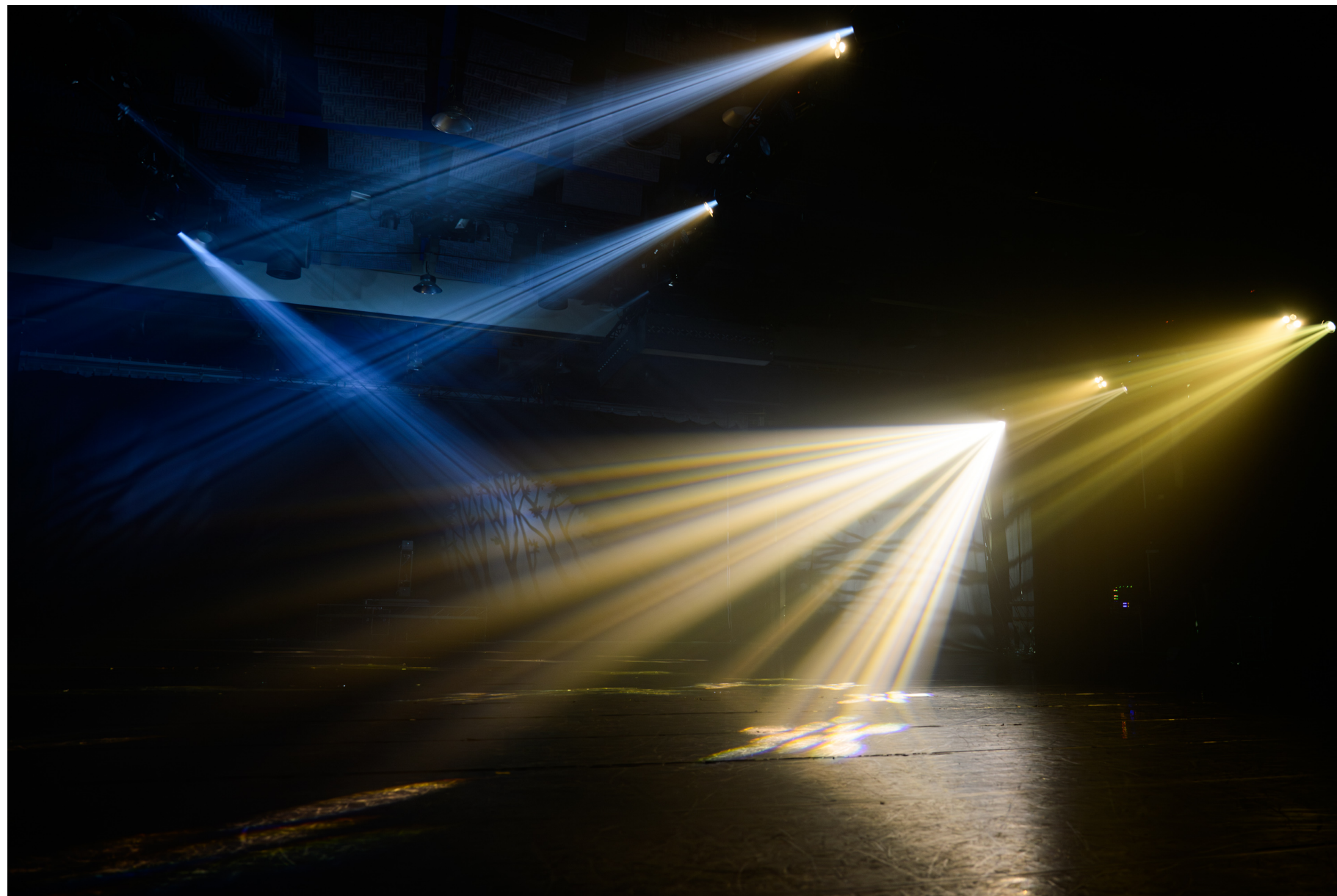
洞穴森林 - 以360度轉動的電腦燈表現環繞四周的森林光影